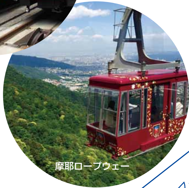
摩耶ロープウェー